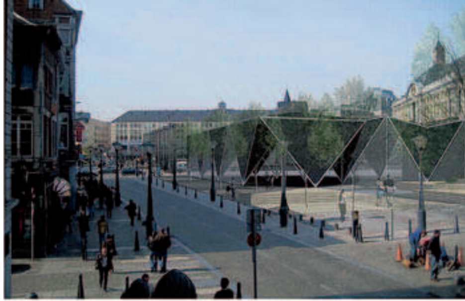
LES ARCHITECTES LIÉGEOIS s'en sont donné à cœur joie pour imaginer des chapiteaux plus originaux les uns que les autres. Ici le projet « Origami ».

Le dossier de l'aménagement de l'espace Tivoli, entre la place du Marché et la place Saint-Lambert, se hâte avec beaucoup de lenteur. Le cabinet français Alphaville a certes produit une étude englobant l'Archéoforum, l'église Saint-André et la deuxième cour du palais des princes-évêques dans sa réflexion.