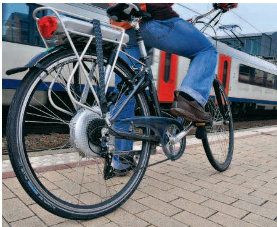
Des vélos électriques pourraient bientôt être disponibles dans les gares.