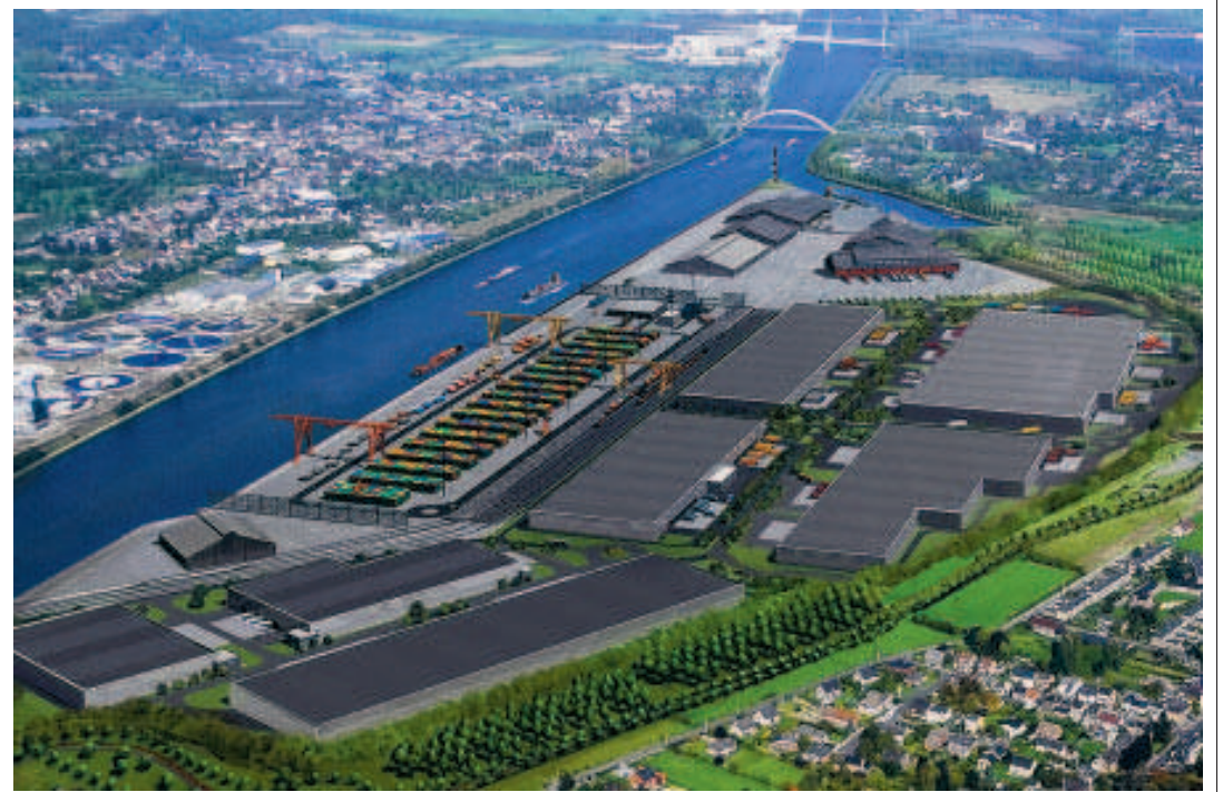
Se dirige-t-on vers une bi-modalité rail-eau en attendant la décision concernant la route? ■ PAL